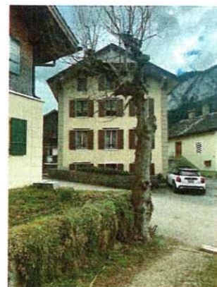
Arbre à abattre :

limite des constructions selon art. 36 LRou